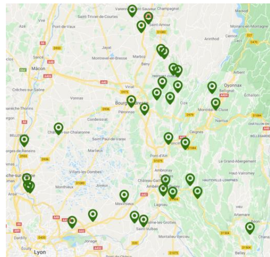
Carte : Nids de frelon asiatique détruits sur le département de l'Ain en 2019

Les conditions climatiques de l'année semblent avoir été défavorables au prédateur. Malgré tout, le frelon asiatique continue sa progression.